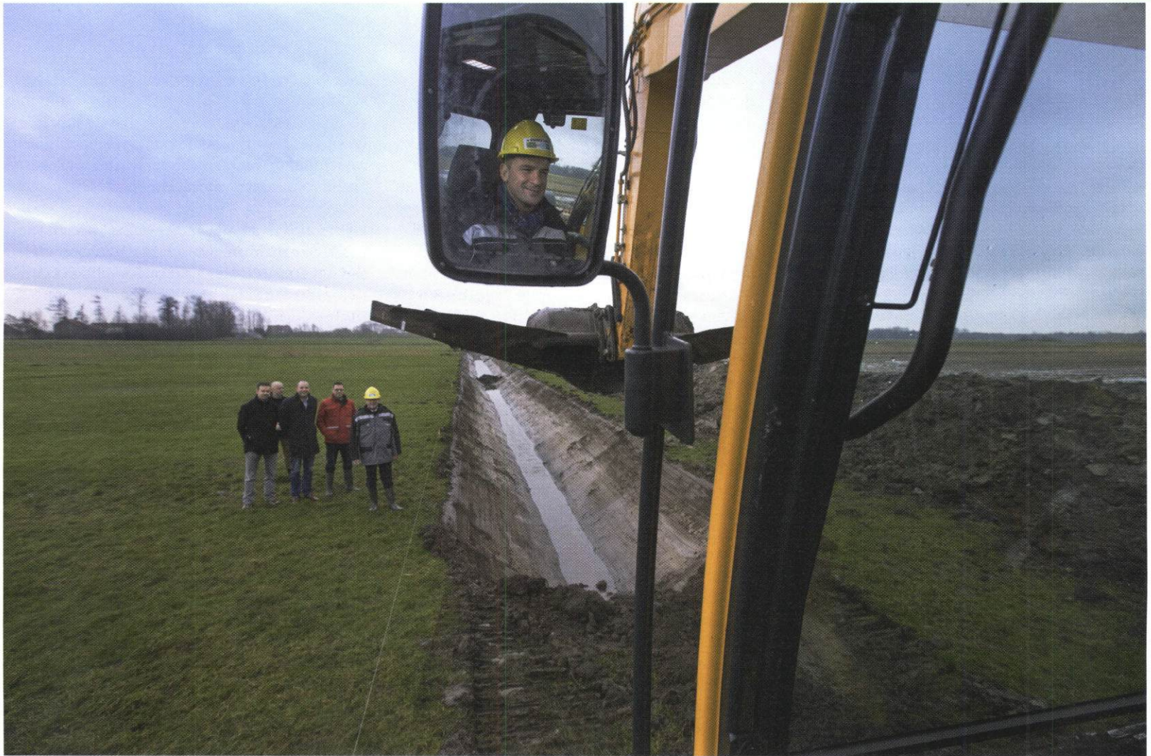
Starthandeling van het project Ruimte voor de Rivier IJsseldelta op 16 januari j.l.