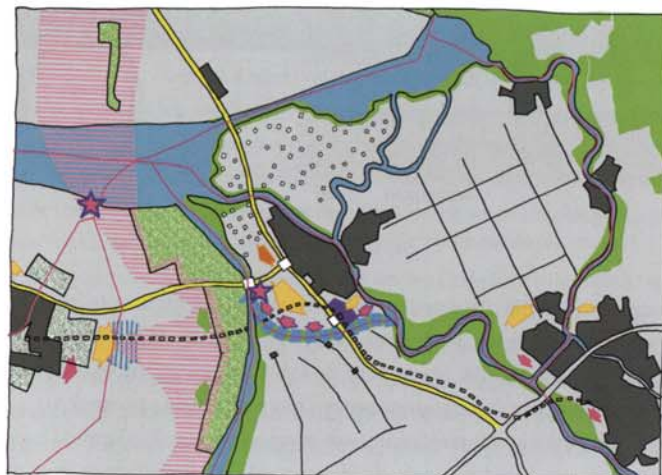
Figuur 2. PKB en Masterplan naast elkaar. Links is te zien welke ruimtelijke reservering de PKB heeft gemaakt voor verschillende maatregelen, waaronder de bypass die op de langere termijn in dit gebied hoe dan ook noodzakelijk is. Rechts is verbeeld aan welke oplossing de betrokken partijen de voorkeur geven in het Masterplan: een nieuw aan te leggen bypass, onderlangs (zuidwaarts) van Kampen. Ambities voor nieuwe woningbouw en bedrijvigheid ten zuidwesten van Kampen maken onderdeel uit van het Masterplan.

Ten tweede de Kaderrichtlijn water. Deze heeft als doel de kwaliteit van de wateren in de Europese Unie in een goede toestand te brengen en te houden. Per waterlichaam wordt in de stroomgebiedbeheersplannen vastgelegd wat die goede toestand is, ofwel wat de doelen zijn en hoe deze bereikt kun-