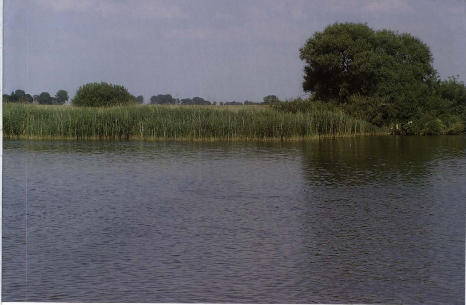
Rietoevers aan Vossemeer en Drontermeer.